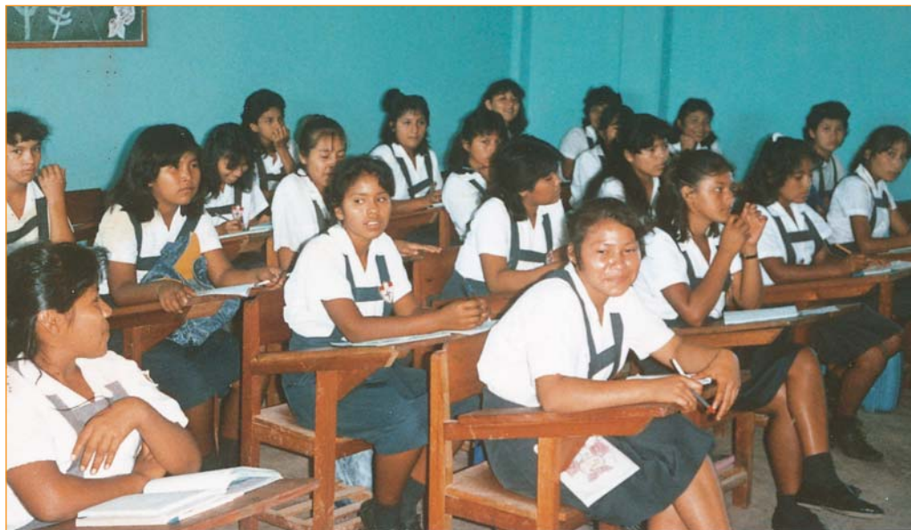
► En el colegio-Internado de Koribeni de la Misioneras del Rosario.