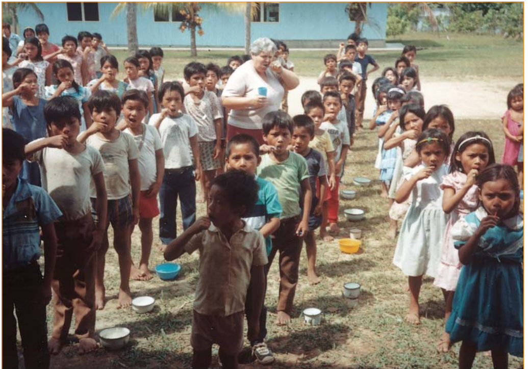
► Misionera Mártir Coso después del desayuno

En concreto; ¿Qué me mueve después de cuarenta años para escarbar en estos recuerdos? Pues eso, que ya soy anciano; vivo de recuerdos y el Señor, me hace recordar las cosas, casos y personas queridas que, pasando por mi