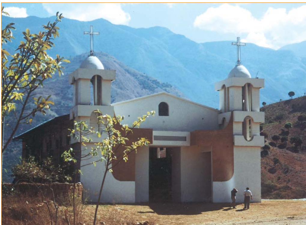
► Iglesia del Señor de Torrechayoc