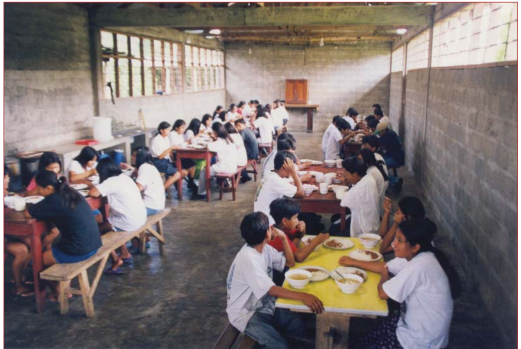
► Comedor actual del internado de Shintuya

Dotar de la infraestructura y atención adecuada a los jóvenes de comunidades de la zona de Shintuya que han terminado sus estudios de primaria y desean acceder a estudios de Secundaria. El Internado se organiza en dos pabellones, uno para varones y otro para mujeres.