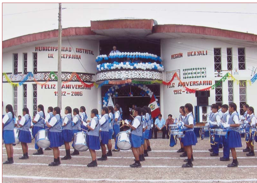
► Sepahua en la actualidad y en fiesta

segunda persona: ¿Cómo estás? Se que estás bien, aprendiendo a conocerte. Es correcto, porque es un mandato "conócete a ti mismo". ¿Pero sabes cómo llegaste a ser lo que hoy eres? Debes remontarte a tus orígenes para conocerte bien. ¿Sabes en dónde naciste, qué historia han tenido tus abuelos y tus padres? ¿Sabes qué niñez has tenido? Te digo: Has nacido en Sepahua, hoy distrito, en la selva peruana, departamento de Ucayali. Pero entonces Sepahua no era distrito sino una misión católica, una comunidad nativa. Antes de ser del departamento de Ucayali era de Loreto. Tus abuelos paternos eran ashaninka, tus abuelos maternos eran Yine o Piro. Tus padres han nacido también en la misión y allí se han educado. Tus abuelos han vivido esclavos en las haciendas y se han liberado por la misión. Tu has tenido una gran suerte, el haber nacido en la misión. Allí has estudiado primaria, secundaria, y te has hecho cristiano católico. Has recibido una buena formación. Has tenido buenos profesores. Pero también has nacido en una comunidad nativa y tienes la formación tradicional. Eres bilingüe de nacimiento. Hablas bien el idioma de tu madre y regular el idioma de tu padre. Pero hablas también bien el castellano. Sigo preguntándote: ¿Cómo ha sido tu niñez? Te respondo: Has tenido