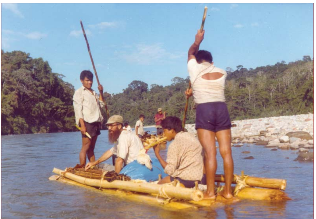
► Eran los tiempos de D. Antonio Valentín

Higiene pública en la que cuentan con prestigio, a veces exagerados, su brujo o "curaca". La naturaleza proporcionará las plantas y ritos necesarios para sus recuperaciones sanatorias. Nuestros medicamentos no son muy aceptados ni acertados, según ellos. Por eso desconfían.