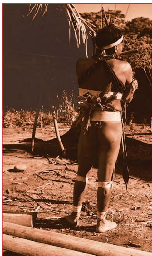
► Así eran los amahuacas entonces.

“ Los Amahuacas descienden de un antepasado llamado Hindachindiya, que todos consideran su fundador, el cual no tenía esposa, por lo que engendró a su hijo de un fruto llamado XOPA, que era grande y negro. El fruto estaba siempre en peligro, pues había muchos depredadores que lo roían o comían. Por eso lo colocó en una hamaca sobre el fuego para protegerlo. Pero nadie lo cuidaba. Hindachindiya esperaba su maduración y el brote de su producto. Un día pasó a su lado un animal, que movió la hamaca y el fruto se cayó al suelo y se rompió. Ante el estupor de Hindachindiya, del fruto salieron dos crías, un niño y una niña, mellizos. El niño se murió, por eso los amahuacas no aceptan los mellizos, uno debe morir. La