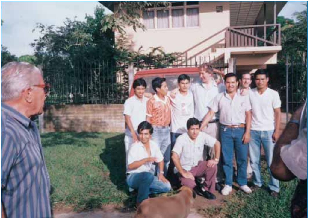
Seminario de Puerto Maldonado.

El evangelizador (misionero) es el hombre decidido, audaz, entusiasta. Pablo VI afirmaba en la Evangelii Nuntiandi (Nº69) «Ellos son emprendedores y su