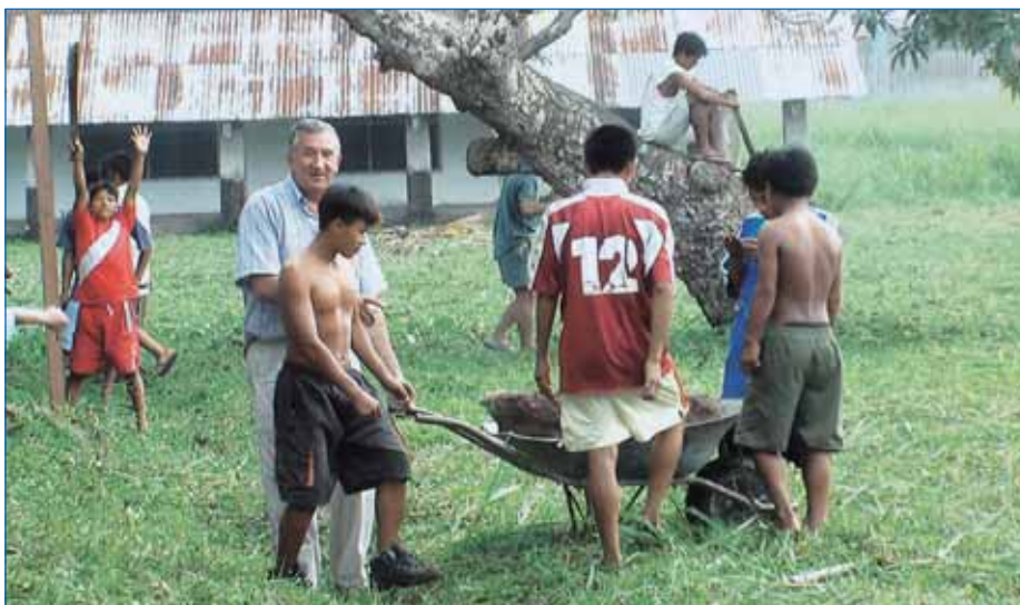
Interno de Sepahua en tareas de mantenimiento.

Desde este boletín deseamos invitarle a ver nuestra exposición "100 años de Misión". Para usted y sus familiares será un encuentro palpable con la realidad de la selva peruana con la que