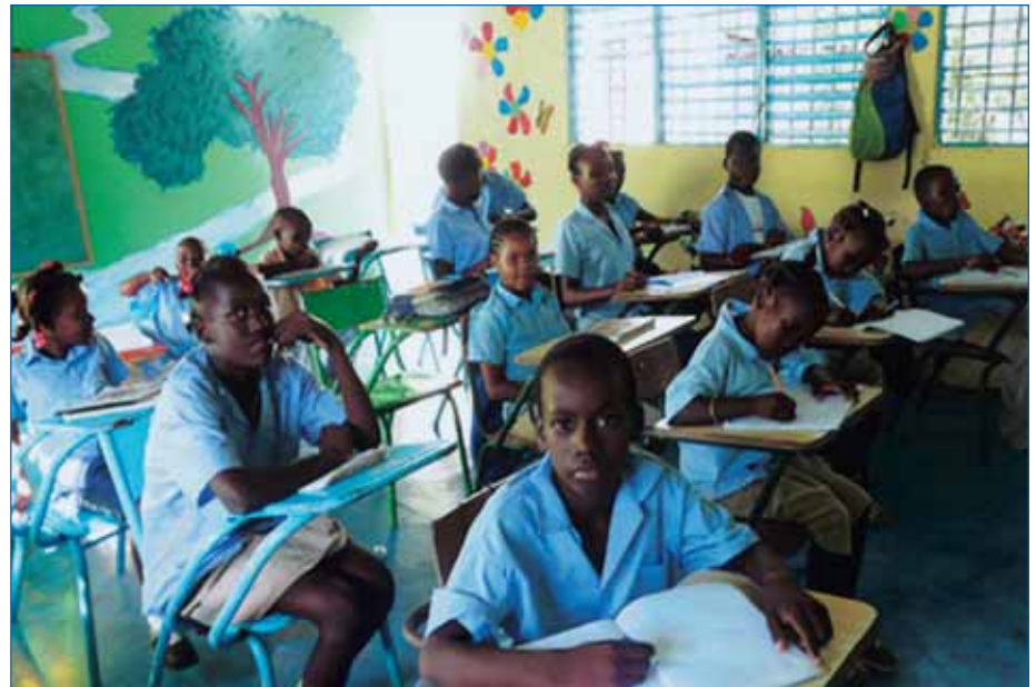
Sala de estudio en el batey de los Almácigos.