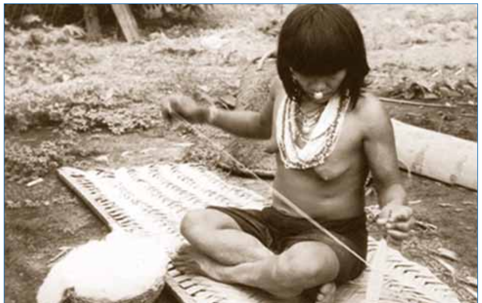
Mujer amahuca hilando.

En cierto modo los amahuacas no necesitan grandes extensiones para la agricultura. Las mujeres recogen tubérculos silvestres y van repoblando la selva, constituyendo a ésta en chacra perenne y de poco trabajo. Para sembrar maíz, hacen chacra grande. Utilizan las herramientas, machete y hacha, pero ni picachean los árboles ni queman la chacra. El maíz se siembra entre las ramas de los árboles y crece al mismo tiempo que la maleza. La cosecha se hace con gran dificultad para el extraño, pero es normal en los amahuacas el abrirse camino entre la maleza y los ramares para recoger todas las mazorcas.