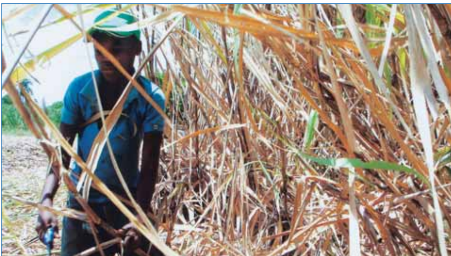
El corte de caña.

La zafra, tiempo de cosecha de la caña, dura desde noviembre hasta junio. En este tiempo todos, en su mayoría nacionales haitianos, se levantan cuando sale el sol y dejan descansar el machete cuando las lomas de la cordillera oriental lo ocultan. Es impresionante ver pasar los camiones cargados de braceros, de pie, que son llevados desde sus humildes casitas en los bateys, propiedad de la Compañía, hasta el lugar donde se está cortando la caña. No se les ve en las manos más que el machete y durante el día sólo comen caña, quizás un