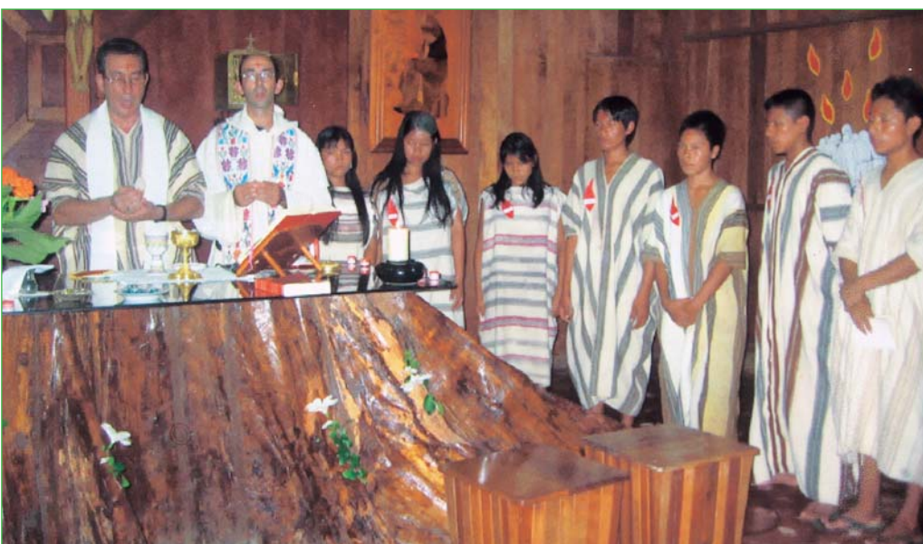
Confirmaciones en Kirigueti por Mons. Francisco González, OP

El segundo reto lo constituyen los altos índices de prostitución, incluida la infantil, el alcoholismo como cultura, la corrupción como sistema, un tráfico de drogas que ha generado una alarmante drogadicción en el mundo juvenil e infan-