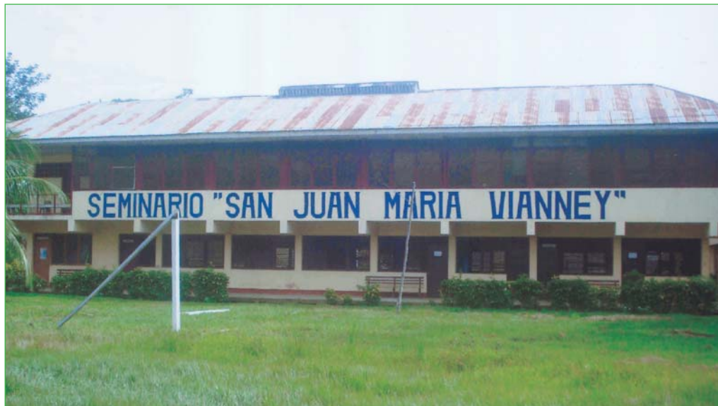
Seminario de Puerto Maldonado

Presupuesto: 70.200,00 $USA Se solicitan: 70.200,00 $USA